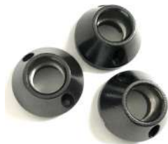
AT-MA-MB/R3 - монтажное основание для AT-AC-R3-W