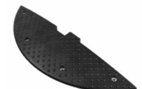
ИДН-900-2 концевой элемент