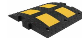
ИДН-500-1 средний элемент