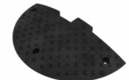
ИДН-500-2 концевой элемент