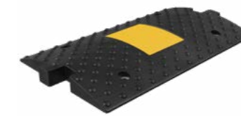
ИДН-300-1 средний элемент