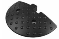
ИДН-300-2 концевой элемент