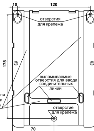
Рис.2 Основание. Присоединительные размеры

При установке АС на высоте и её дальнейшем обслуживании необходимо соблюдать правила техники безопасности при работе на высоте. Не реже одного раза в год осуществлять внешний осмотр АС и проверять качество подсоединения выводов к управляющему устройству.